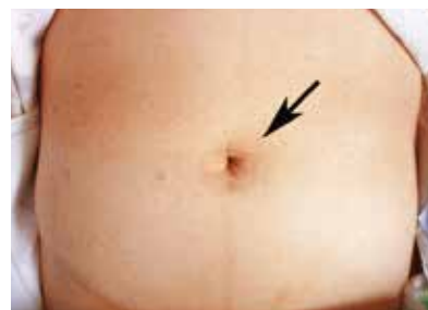
図4 単孔式手術の創

しかしこの手技が、通常の腹腔鏡下手術より一歩進んだ難しいものであることは確かですので、十分な修練を積み、多