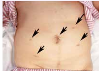
図2 腹腔鏡下手術の創

腹腔鏡下手術の中でもさらなる低侵襲化を目指したものとして、単孔式腹腔鏡下手術があります。