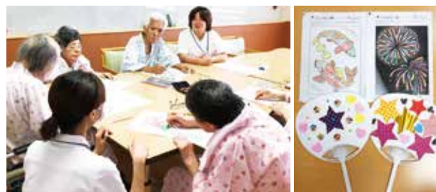
余暇時間に、塗り絵やカレンダー、団扇などを作成しました。